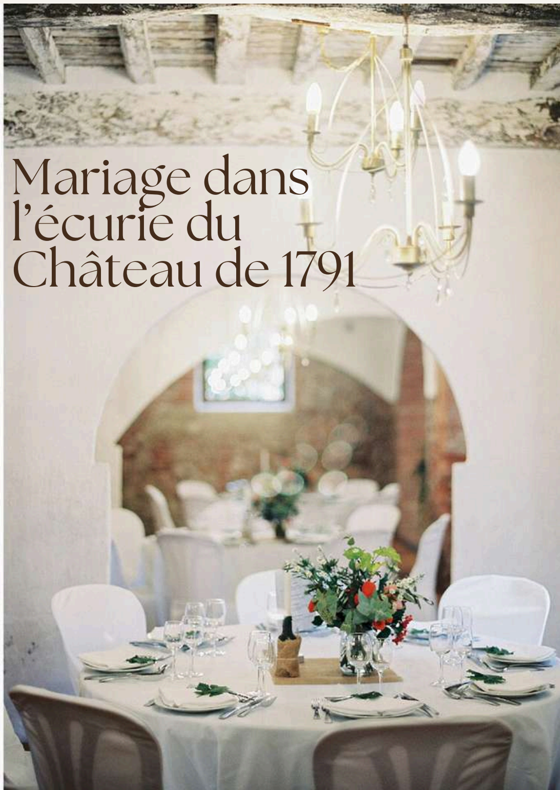
Mariage dans l'écurie du Château de 1791